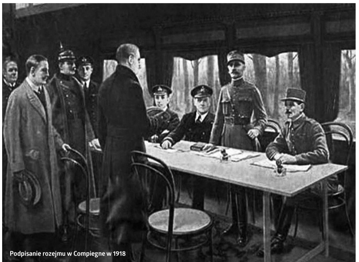
Podpisanie rozejmu w Compiègne w 1918

Łącznie na wszystkich frontach pierwszej wojny światowej zginęło bądź odniosło rany 37,5 miliona żołnierzy.