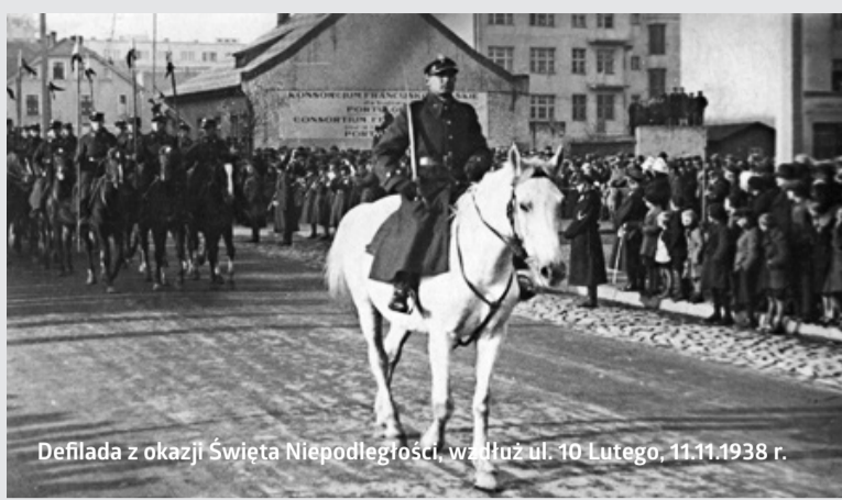
Defilada z okazji Święta Niepodległości, w ul. 10 Lutego, 11.11.1938 r.